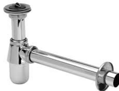
Viega Plugbekersifon met muurbuis en rozet, chrom