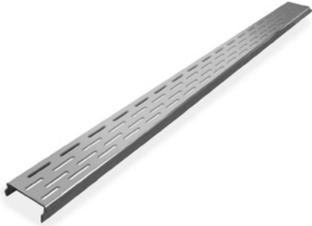
Showerdrain met RVS rooster 68,7 cm