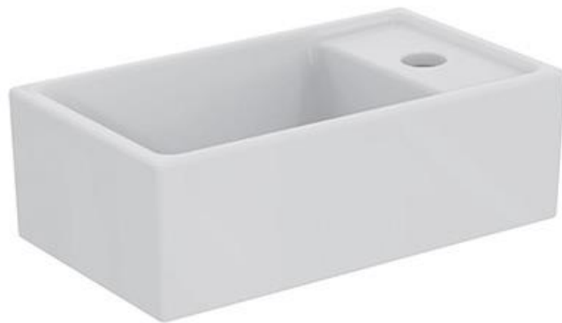
Ideal Standard Fontein 37cm x 21 cm met kraangat rechts, wit