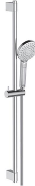
Ideal Standard Glijstangcombinatie 90 cm met handdouche met 3 functies 8 l/min en Idealflex 175 cm doucheslang chrom

De badkamer wordt voorzien van een elektrische handdoekradiator dnl E-Comfort Claudia EcoDesign 40 x 119,5 cm, 600 Watt, in RAL9016 met digitale thermostaat