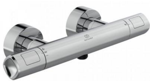
Ideal Standard Douchethermostaat cool body chrom