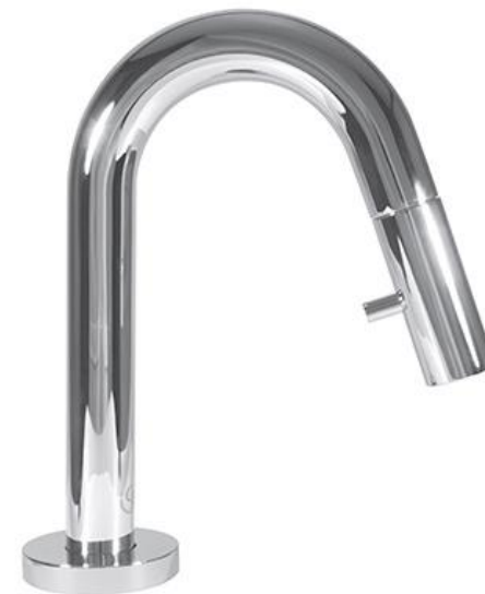
Ideal Standard Koudwaterkraan 6 l/min met hoge uitloop en geïntegreerde bediening in chrom