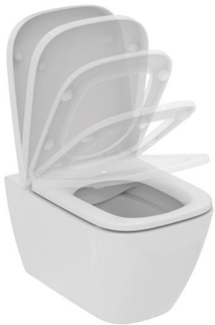
Ideal Standard Wandcloset, i.life rimless met softclose zitting en deksel, kleur wit